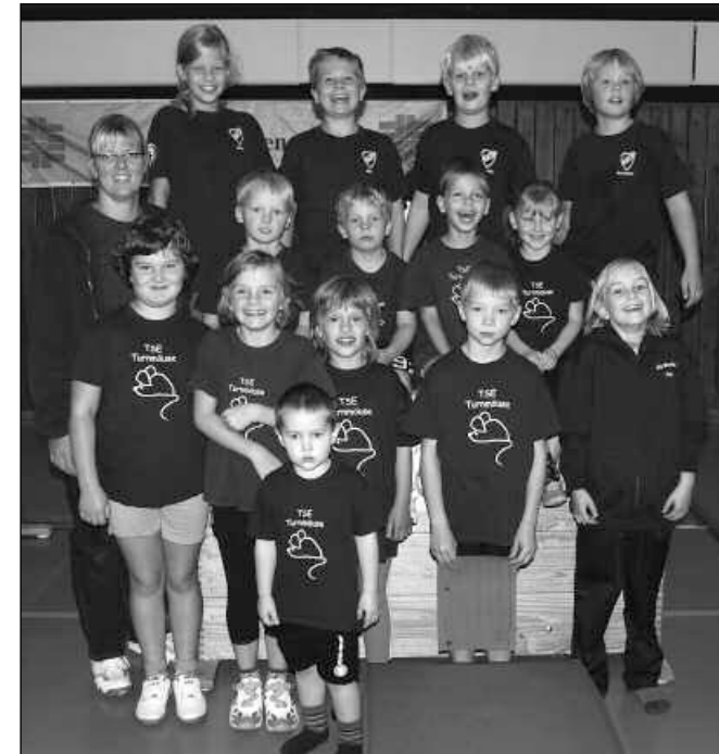
Unsere Nachwuchsturner auf einen Blick

Mittwoch, 17.00 - 18.30 Uhr bei Lisa, für Kinder von 5 – 10 Jahre (Halle AHS)