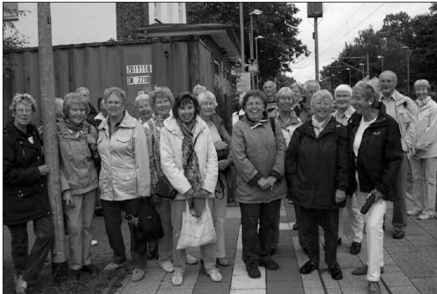
Gruppenfoto auf dem Weg zur Landesgartenschau